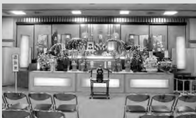
（写真は会館ホール）