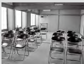
（写真は浄縁塔仏間） （小会場もございます） （20名程度）