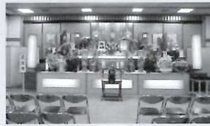
（写真は会館ホール）〈50名～200名〉

小樽別院会館ホールにて通夜・葬儀会場として使用できます。亡き方がくださった大切なご縁をせひ菩提寺にて。 詳細につきましては寺務所までお問い合わせください。