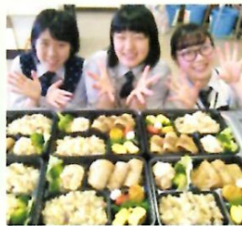
フードコーディネーター専攻 お弁当の調理