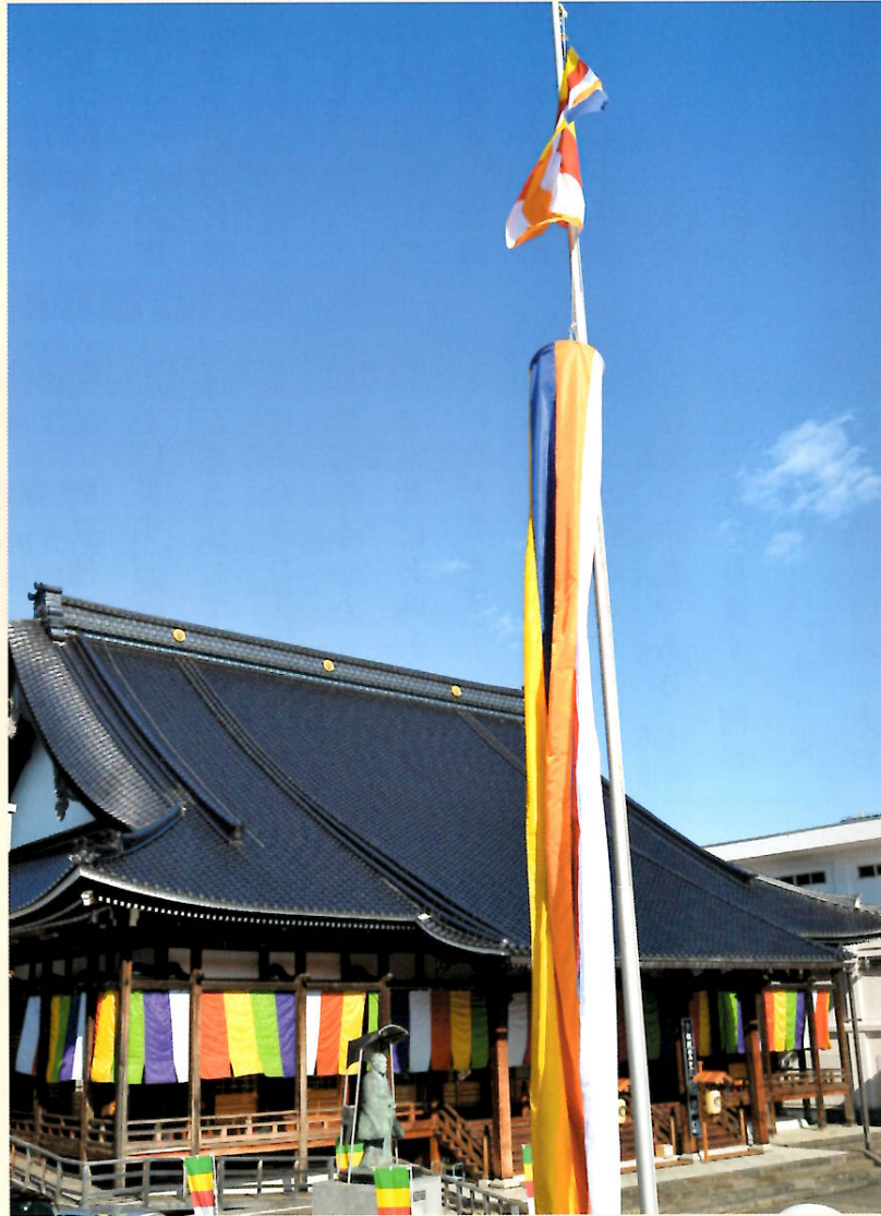
本堂にたなびく仏旗