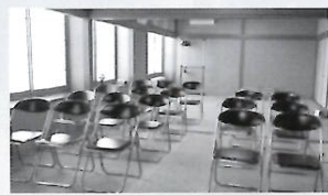
▶小会場もございます（20名程度）