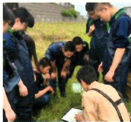
サイエンス専攻 水生生物調査の様子

2年次から始まるドリームプロジェクトでは、学びの原点にある「知りたい」という気持ちを、サイエンス・ビジネスマーケティング・スポーツアスリート・フードコーディネーター・グローバルカルチャー・医療福祉の6つの専攻に分かれ、教室の内外で深く探究できます。