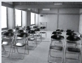
（写真は浄緑塔仏間）