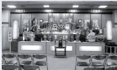
（写真は会館ホール）〈50名～200名〉

小樽別院会館ホールにて通夜・葬儀会場として使用できます。亡き方がくださった大切なご縁をぜひ小樽別院にて。詳細につきましては寺務所までお問い合わせください。