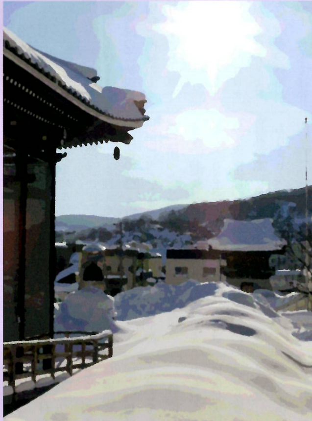
本堂より見る境内