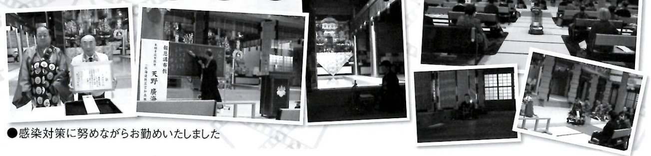
●感染対策に努めながらお勤めいたしました