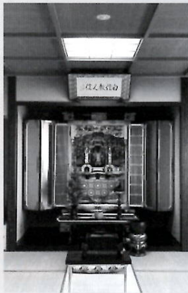
▶ 浄縁塔仏間 (三〇名)