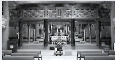
▶ 会館ホール (二〇〇名)