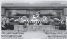
▶ 会館ホール (2000名)