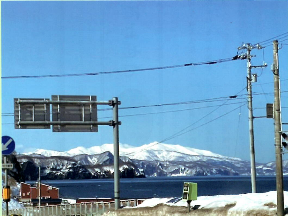
塩谷から見る石狩湾

5月22日(日) 【法 要】13時30分より 本堂にて ※降誕会は親鸞聖人のご誕生を祝う法要です