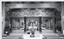
▶ 本堂 (1100名)