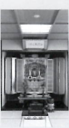
▶ 浄土塔仏間 (300名)