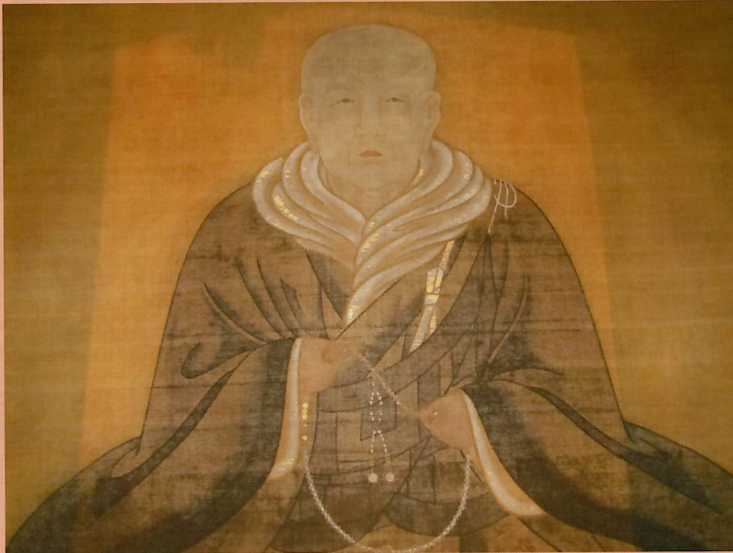
親鸞聖人絵像(小樽別院本堂左脇壇ご安置)