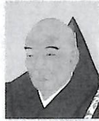
第九代 実如宗主 (1458～1525)

円満寺に一冊の御文章(三帖目十五通)があります。末尾に記された「実如(花押)」の形から、九代実如上人の最晩年(五百〇五〇二十年前)のものと思われる点です。問題は古さの他に、左右の端が真っ黒になっている点です。この拝読者の手には、洗っても落せない土痕がこびりついていたのでしよう。しかも何百回も読み続けた結果のこすれた痕。その人は、懸命に土とともに日々を送り、仏(ブツ)にならせていただけの尊い思いで人生を歩み、尊い思いで死を受け入れていたのでしよう。「念仏の先祖」の方の心が、現代の私たちの胸中に、ひしと伝わってきます。