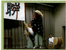
↑双葉祭で松前神楽披露！

小樽双葉高校では現在、硬式テニスの他にも、基礎スキー、バレエ、器械体操でチャレンジ奨学生として活動している生徒がいます。特に基礎スキーは全国レベルで、各大会でも素晴らしい結果をおさめています。過去には、スノーボード、松前神楽、空手などで実績を残したチャレンジ奨学生もいました。