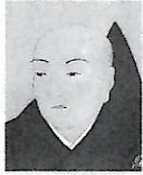
第十代 証如宗主 (1516～1554)

第九代 実如宗主 蓮如宗主の五男、三十二歳で継職され、飛躍的に伸張した教団の維持充実に努められた。蓮如宗主の「御文章」を中心とした教義の確立につとめ、「五帖」八十通を編纂された。また「門」家制の確立など教団体制の整備に尽力し、六十八歳で示寂。